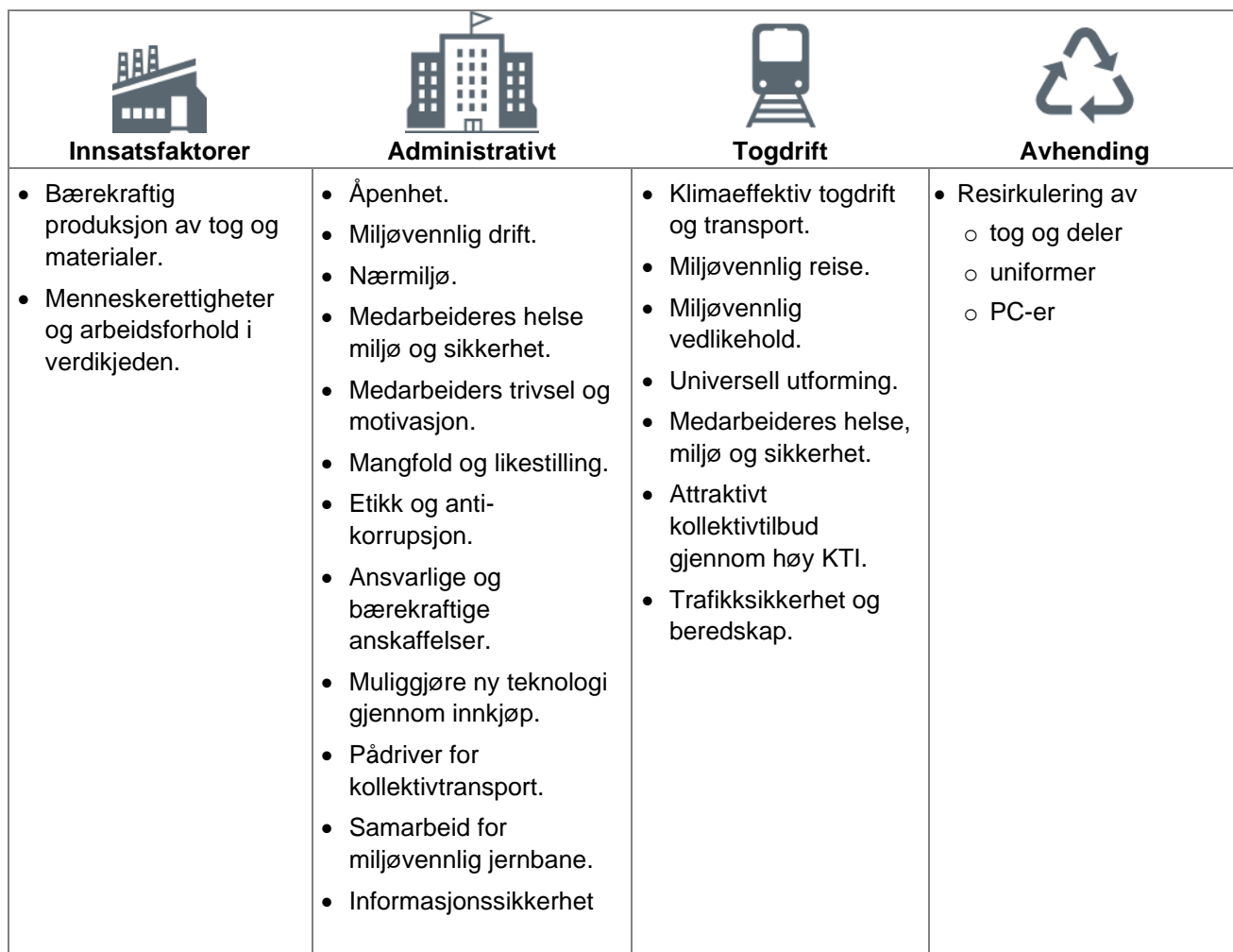
Tabell 1. Resultatene av verdikjedeanalysen. De viktigste bærekraftselementene er satt inn i Flytogets verdikjede fra anskaffelse til avhending.

Flytogets miljørettede holdninger og ditto arbeid, er gjennomgående i alle sammenhenger. Det stilles alltid miljøkrav i drift og administrative prosesser. En betydelig og mulig eksponering vil være innenfor anskaffelser. Her er både påvirkningsmulighetene og konsekvensene store.